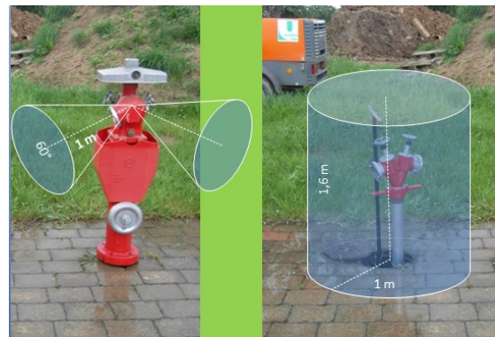
Abbildung 2: frei zu haltende Bereiche

Ausgehend von den Abgängen DN 65 des Hydranten dürfen sich keinerlei Hindernisse innerhalb eines Sektors mit 60^\circ Öffnungswinkel von 1 Meter Abstand (gemessen ab Hydrantenmitte) befinden. Bei Verwendung anderer Überflurhydranten ist zusätzlich der Bereich um den Ansatzpunkt des Hydrantenschlüssels am Hydrantenkopf frei zugänglich zu halten (1 Meter Radius um die Hydrantenkopfmittle), bei Unterflurhydranten ist ein zylindrischer Bereich von 1 Meter Radius und 1,6 Metern Höhe, gemessen von der Mitte der Unterflurhydrantenkappe, von jedweden Hindernissen frei zu halten.